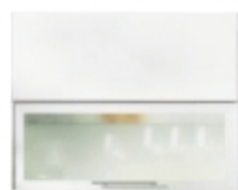
ПДЧ + Широк ALU профил