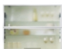
Тесен ALU профил