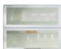
Широк ALU профил