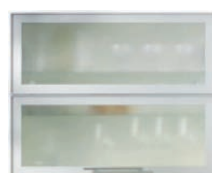
Широко ALU профил