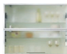
Тесен ALU профил