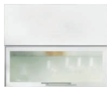
ПДЧ + Широко ALU профил