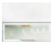
ПДЧ + Широко ALU профил