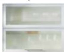
Широко ALU профил