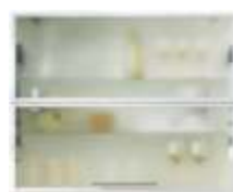
Тесен ALU профил